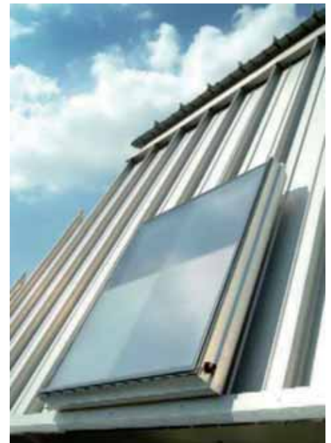
Die von Fraunhofer ISC entwickelte Antireflex-Nano-Funktionsschicht für Solarabdeckungen erhöht die Energieausbeute von Solarkollektoren und Photovoltaik-Anlagen. Sie wird im kostengünstigen Tauchverfahren hergestellt, ist witterungsbeständig und reinigt sich durch Regen quasi von selbst.

gesteuert wird. Ich kann dann wählen, ob die Wärme hereinkommen soll oder nicht. Das kann ich bei der normalen Wärmeschutzverglasung natürlich nicht. Bei ihr muss vorher entschieden werden, ob die Beschichtung in heißen Zonen eingesetzt wird, ob also der Klimatisierungsaufwand reduziert werden soll, oder ob das Gegenteil der Fall ist, also der Heizungsaufwand verringert werden soll. Danach muss die Beschichtung ausgewählt werden. Mit der elektrochromen Verglasung kann ich beides machen, denn deren Beschichtung lässt sich ein- und ausschalten. Bei diesen schaltbaren Verglasungen spielt Nanotechnologie eine Rolle. Eine andere interessante Anwendung der Nanotechnologie im Bereich der Verscheibung ist das Sauberhalten von Oberflächen. Das heißt, das Fenster wird mit einer dünnen Schicht eines Halbleiters, zumeist Titandioxyd, ausgerüstet. Wenn die Schicht dünn genug ist, stört sie optisch nicht und hat dazu die Eigenschaft, dass sie in Gegenwart von Licht an der Oberfläche Schmutz abbauen kann. Das nennt man Photokatalyse. Diese Fensterscheiben bleiben länger sauber, weil der Regen und das Licht zur Reinigung