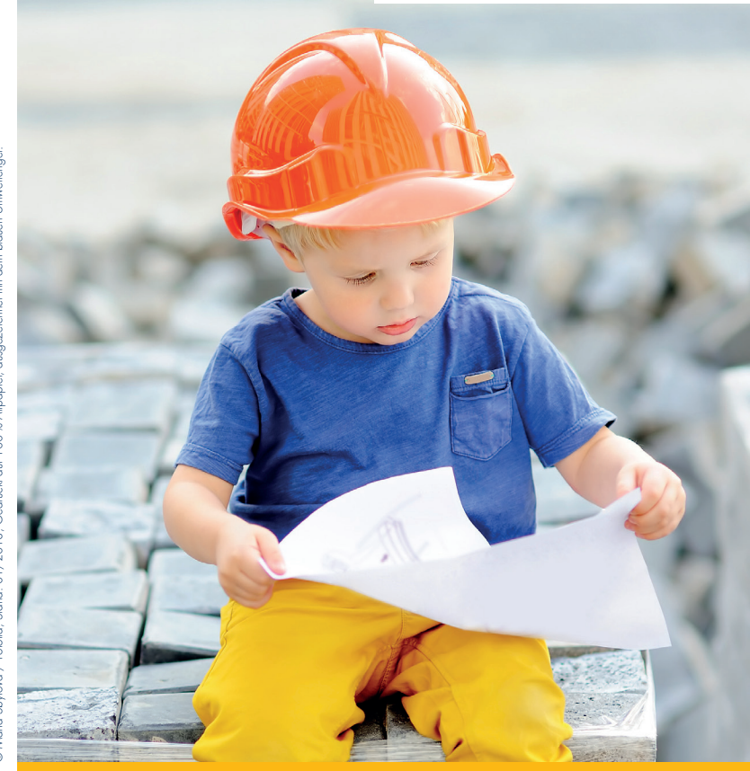
Stand: 01/2018, Gedruckt auf 100% Altpapier, ausgezeichnet mit dem blauen Umweltsiegel.